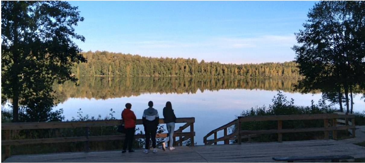
Раннее утро над Светлояром

Покидают Светлояр тоже по традиции с наступлением