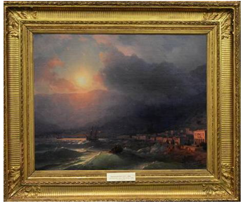
Копия картины И. К. Айвазовского «Приморский город. Вид Ялты»

«Ночь» в кузнецком музее открыли учащиеся музыкального колледжа, затем посетителям предложили к просмотру художественный фильм. Но важнейшим из искусств в тот вечер в КМВЦ была живопись. Собственно, и фильм был о ней, точнее – о жизни и творчестве великого русского художника, турка по происхождению, армянина по воспитанию Ивана Константиновича Айвазовского (его имя при рождении – Ованнес Айвазян). Фильм «Секретные краски Айвазовского» – часть проекта «Музей одной картины», подготовлен он коллективами картинной галереи им. Савицкого, Пензенского драматического театра и режиссёром Ларисой Трушиной. В Кузнецк эта кинолента вместе с копией картины Айвазовского «Приморский город. Вид Ялты» (оригинал находится в Пензенской картинной галерее) были доставлены в декаду землячества – в начале сентября. За два месяца большое количество кузнецан открыли секрет красок «Царя моря» (так называл Айвазовского Николай I). Некоторые по несколько раз открыли: приходили на повторные просмотры. Фильм действительно интересный, потому что главный герой – личность уникальная и судьба его удивительна. Первые рисунки Айвазовского, родившегося в очень небогатой семье в Феодосии, смыло море – на песке они были нарисованы.