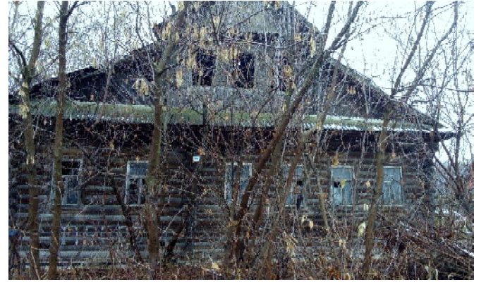
Этот старый-престарый дом «с ликом византийской иконы» помнит Пришвина, Гиппиус, Мережковского... Село Владимирское, Воскресенский район, Нижегородская область

почти все жители Владимирского, а вот о «поднятой» избе «благообразной вдовицы», запечатлённой в произведениях Гиппиус и Пришвина, никто ничего в тот раз сказать не мог.