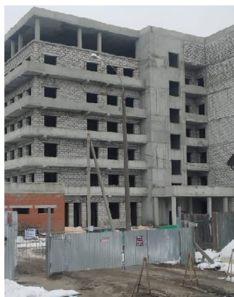
Согласно свежему паспорту объекта, срок выполнения работ по строительству хирургического корпуса – 15 октября 2027 г.

«Скрывать не буду, ситуация не самая радужная, но не самая печальная – по прогнозам ожидалась хуже. Тем не менее бюджет будет приниматься на 2023 год с такими цифрами: доходная часть – около 71,5 миллиарда рублей, расходная часть – около 73 с половиной миллиардов. Бюджет дефицитный, – констатировал Васильев. – Самое основное, что хочу сказать. Я и на общественных слушаниях задавал вопросы по Кузнецку: какие средства будут выделять на город. Из позитивного – это то, что у нас всё-таки планируется строительство взрослой поликлиники, и на хирургический корпус деньги выделяются. Денег выделяется, к сожалению, не так уж и много: на 2023 год всего лишь 100 миллионов,