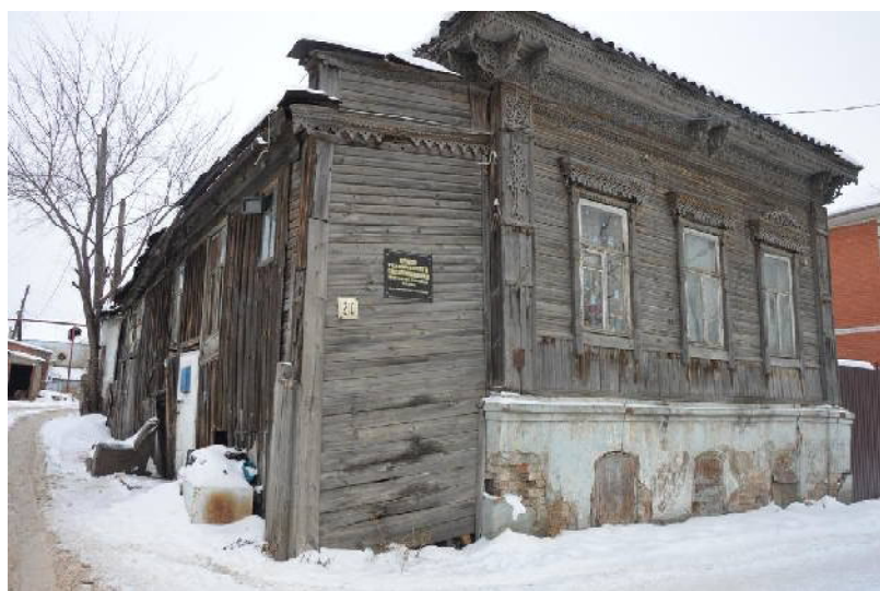
Д. №210 по ул. Рабочей планируется расселить в 2024 – 2025 гг.