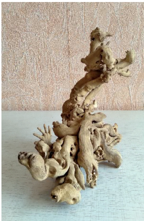
Скульптурная композиция «Апокалипсис» (корень клёна)