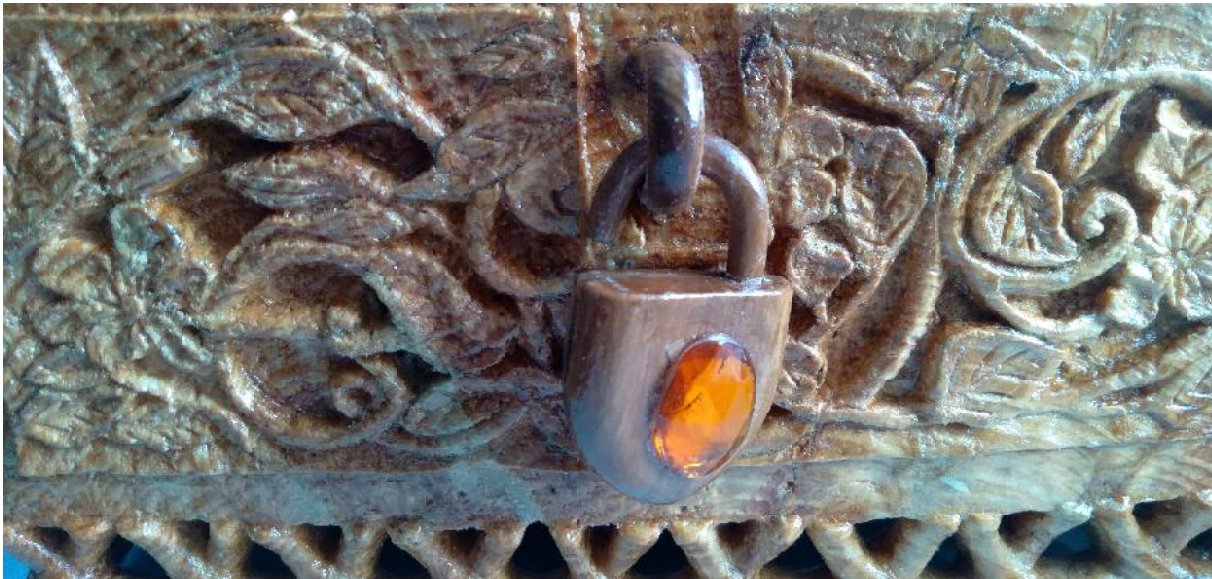
Фрагмент шкатулки с миниатюрным замком (сосновый кап)