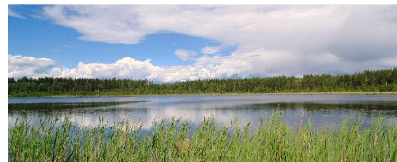
Озеро Светло-Эзекеевское, северная «вершина» ломаной Осипова

Особого разговора требует озеро Карьер. В отличие от названных естественных озёр, этот водоём сформировался – тоже редкий для возвышенной местности случай – на месте заброшенного карьера (отсюда и название). Оно существует уже почти полвека и не думает пересыхать. Оно не пересыхало даже в аномально засушливое лето 2010 года. Видимо, разработчики карьера «вскрыли» устья трещин, по которым