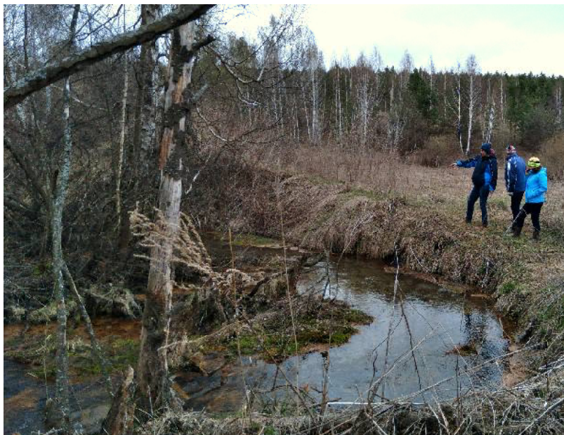
Ещё одно тектоническое чудо: вырывающаяся из недр подземная река – Зелёный (Медный) ключ

Большая часть верховых озёр Пензенской и Ульяновской областей, одни в древности, другие сравнительно недавно, деградировали в болота. А на Сурско-Сызранской гряде они сохранились. Я был уверен, что сохранились они исключительно благодаря расположению на