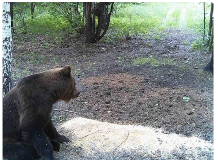
Медведь, зафиксированный фотоловушками в Сосновоборском районе, 2022 г. Со страницы сообщества «Неизвестный сурский край»

рестности села Ульяновка (дачный массив Кармановка – А. К.)