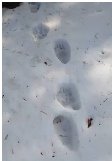
Следы бурого медведя, Сосновоборский район, апрель

Место – Пензенская область, Кузнецкий район, ок-