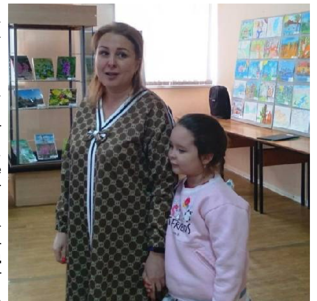
Дочка и внучка писателя

Интересной жизнью живет экологический отряд РДШ «Зелёный патруль» 5-й школы, о деятельности которой рас-