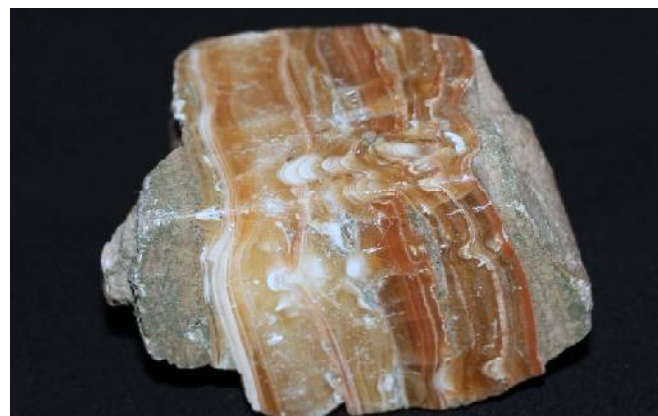
Самоцвет халцедон. Фото Дениса ВОРОНИНА