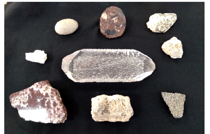
Набор минералов для «тактильного» ознакомления. В центре кристалл, выращенный на «Кузнецком заводе приборов и ферритов».