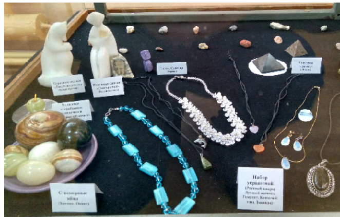
Образцы украшений на основе самоцветов. Фото автора

Такое в нашем городе, видимо, впервые: выставка минералов и горных пород! Случалось, что и раньше «Библиотека-экоцентр» предоставляла посетителям возможность ознакомиться с десятком выставленных образцов «зёрен земли». Теперь образцов около двух сотен!