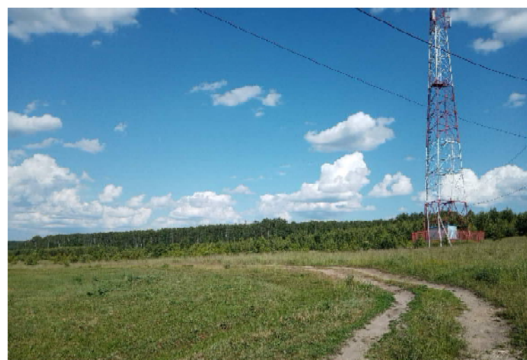
Гуляй – не хочу