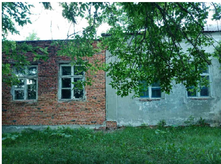
Клуб. Вид спереди