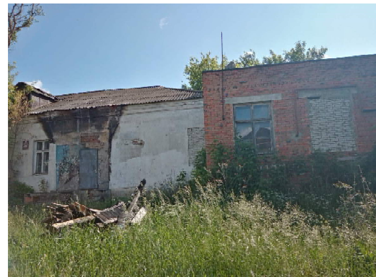
Клуб. Вид сзади