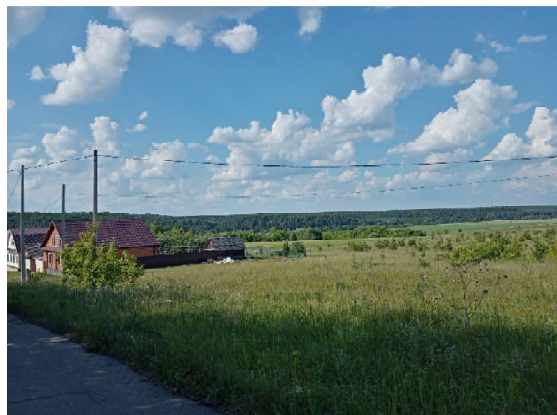
Пустырь на улице Березовой