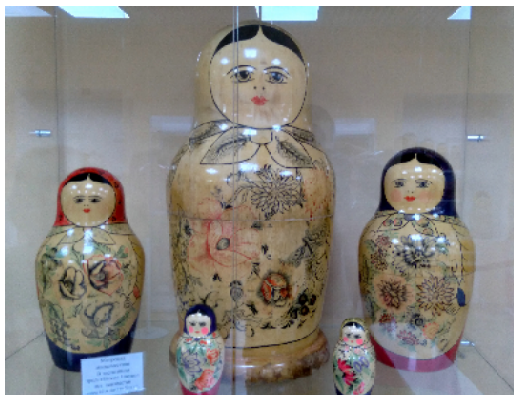
«Строгая» матрёшка, выполненная в старообрядческой традиции села Мериново

А немного не доезжая тем же маршрутом до Воскресенского, можно (и нужно!) посетить историческое поселение Владимирское, где ле-