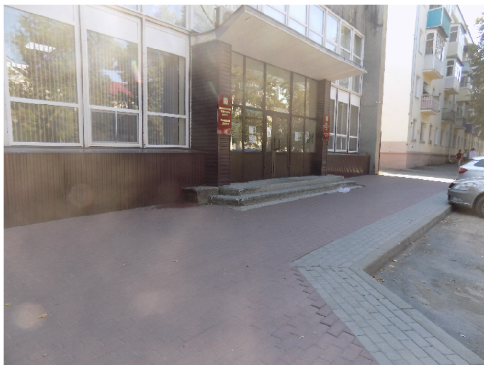
Администрация Кузнецкого района: парадный подъезд и разбитый проезд