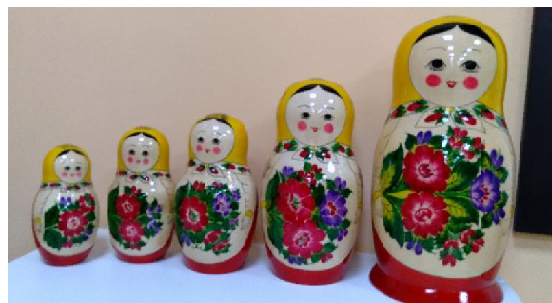
А это копия семёновской матрёшки, «снявшейся» в фильме «Возвращение высокого блондина в чёрном ботинке», выполненная к пятидесятилетию выхода кинокартины

У семёновцев нет проблем с организацией летнего отдыха на воде. Да и вообще до широкого чистого Керженца всего пять километров