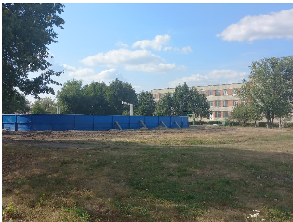
Школа №4 им. Евгения Родионова встречает новый учебный год под новой кровлей и с новой спортплощадкой