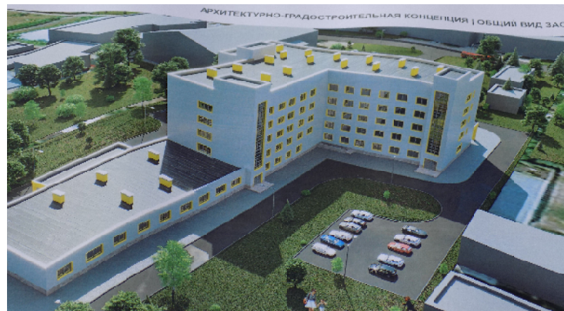
Примерно так будет выглядеть новая поликлиника

Заручившись поддержкой, Сергей Златогорский закон-