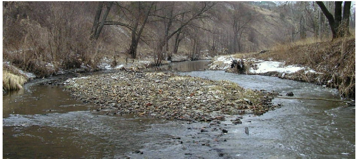
Перекаты на Труёве

А однажды я «познакомился» с Подкумком – рекой в Пятигорске. Куда нашей Инзе с Канадеем, а тем более Труёву до Подкумка, бурлящего горного потока!