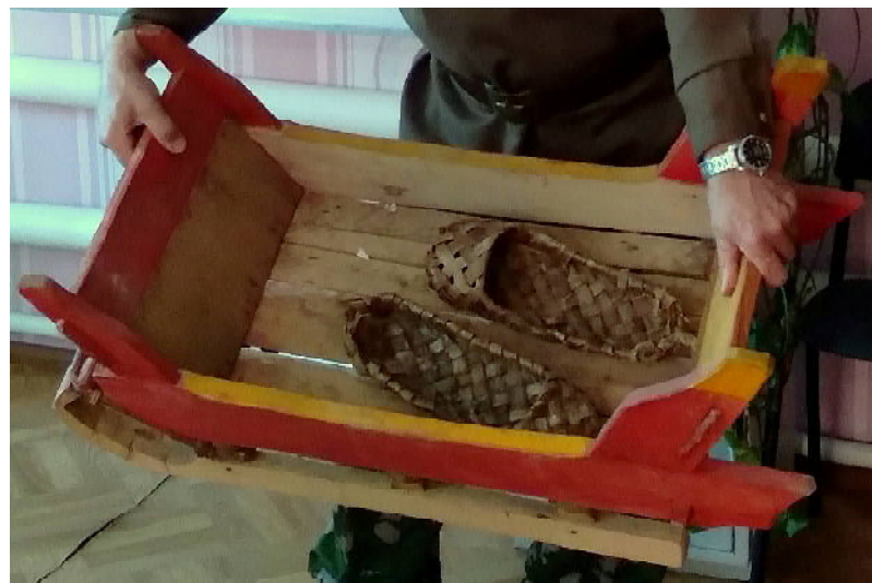
«Технический» образец сюзюмских салазков.

потом она стала цветной. Например, рубель, с помощью которого в крестьянских и мещанских семьях гладили белье, украшался резьбой, напоминающей расписные пряники. Любопытно, что именно это мучное изделие вдохновило сюзюмских мастеров на роспись салазков.