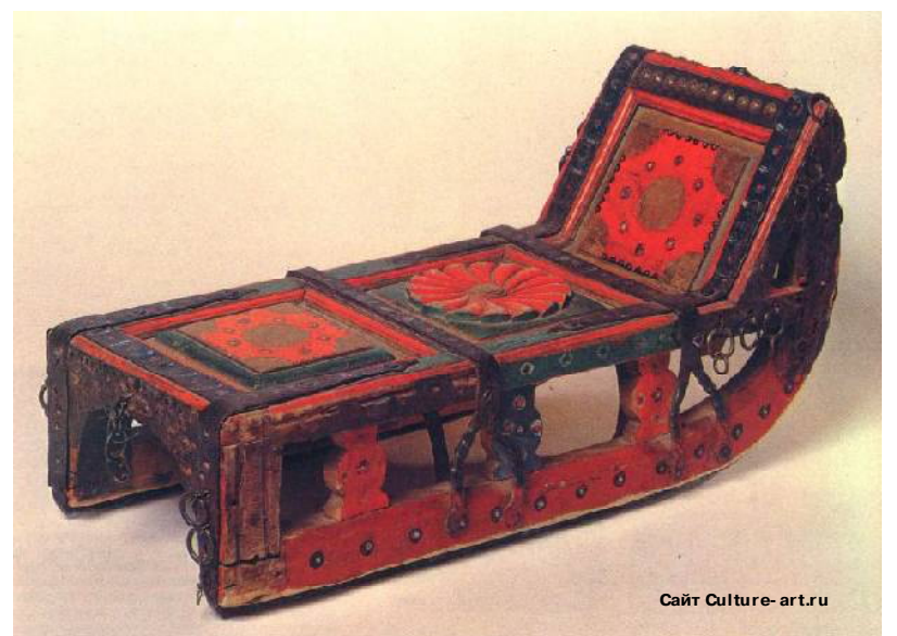
Для сравнения: санки для катания на Масленицу. Начало XX века. Село Черевково Архангельской области

Всё это в музейно-выставочном центре «Золотая хохлома» города Семёнова Нижегородской области. А