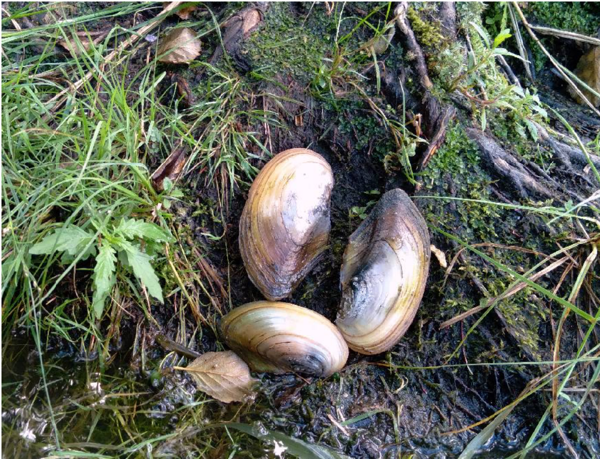
«Светлоярские мидии» в августе. Фото автора