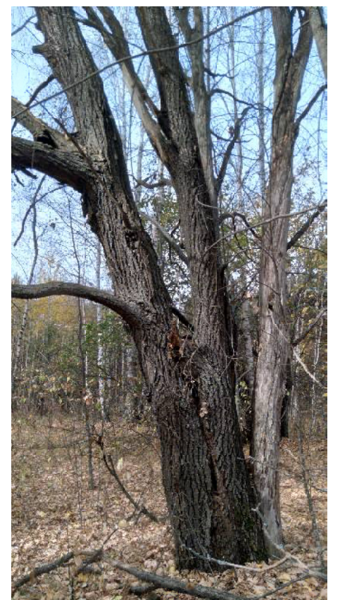
А этот дуб я ошибочно принял за «Дедушку»