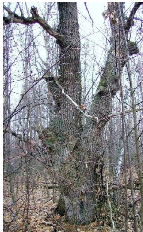
Дуб «Дедушка» в высоту

Есть у меня на примете и дуб (тот самый, на фото 1 и 2), возраст которого я оценил тоже в три века. Мне стало интересно, а отмечены ли в Пензенской области ещё какие-то великовозрастные «царь-деревья», взятые под охрану?