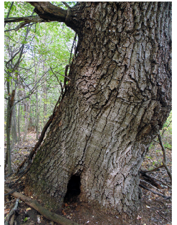
Дуб «Дедушка» (крупным планом)