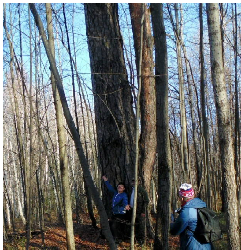
Из районных великанов самый главный великан.