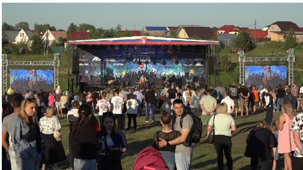
Фотографии фестиваля «Кузнецкий рубеж»