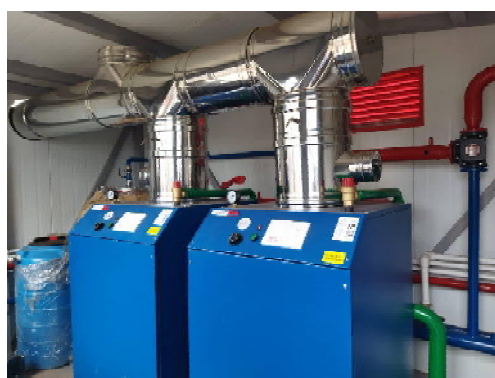
Новая модульная котельная на ул. Октябрьской

Всего в 2023-м году по решению губернатора Пензенской области Кузнецку было выделено 40 миллионов рублей на установку трёх модульных котельных. Первая начинает работать в этом году, остальные – в следующем. И в следующем же году ожидается второй транш – «неэффективных концов» в городе ещё предостаточно.