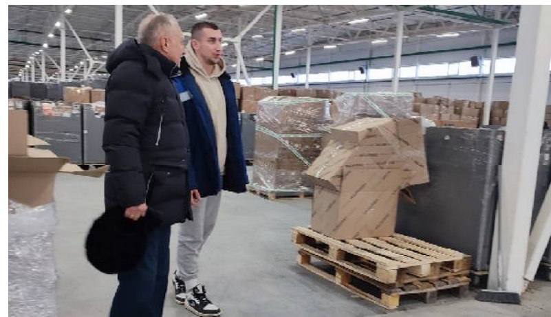
Глава г. Кузнецка в распределительном центре «Wildberries»

Ситуация с работой общественного транспорта, по мнению главы, тоже в норме: «Контроль налажен, но бывают поломки транспорта, бы-