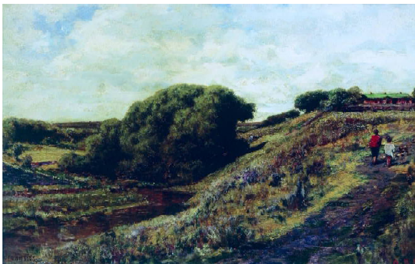
Картина Алексея Петровича Боголюбова «Радищевская усадьба». Справа – фрагмент строений усадьбы, слева река Тютнярь.

«Проехав наш бывшей окружной городок, открывается довольно пространное поле, которое по временам года то серую единообраз-