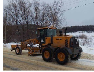
То, что работы велись, подтверждают фотографии, опубликованные на сайте городской администрации