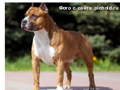
Американский стаффордширский терьер

Однако его доводы опровергались имеющимися по делу доказательствами. Девочка по фотографии опознала в принадлежащей ответчику собаке ту, что причинила ей раны. О принадлежности собаки ответчику сообщили и