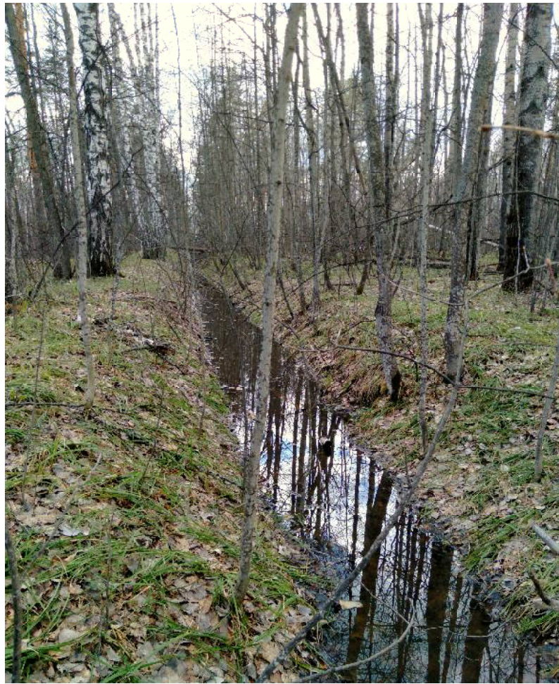
Один из каналов, проложенных в начале XX века, по которому подаётся вода из Горелого болота (Малого озера) в Белое озеро.