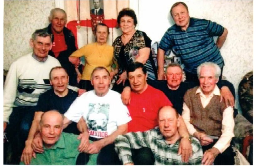
Всегда среди друзей

Расскажу об одной интересной встрече. На 40-летие со дня выпуска группы ветеринарного техникума пригласили преподавателей в том числе. Много было сказано тёплых слов в его адрес за искусно проводимые уроки