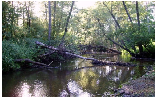
Река Сура возле места впадения в неё рек Качим и Шелемис.

Правда, при всём таком рода позитиве, в высказываниях некоторых шелемисцев по поводу возвращения селу якобы его исторического названия, слы-