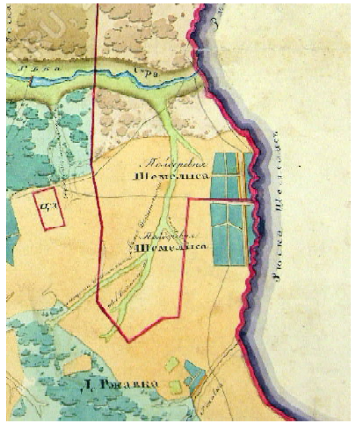
«Кузнецкий_05». Фрагмент «Землемерного чертежа Кузнецкого уезда Саратовской губернии» конца XVIII века с населёнными пунктами Шемелиса и Ржавка.

Итак, вспомним, что на землемерном чертеже XVIII века село и речка обозначены как «Шемелись», «Шемелиса».